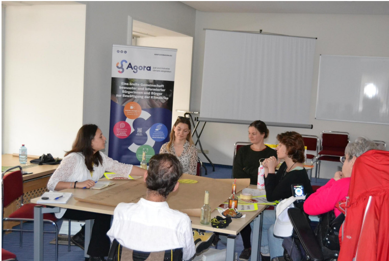
People with disabilities and chronic illnesses