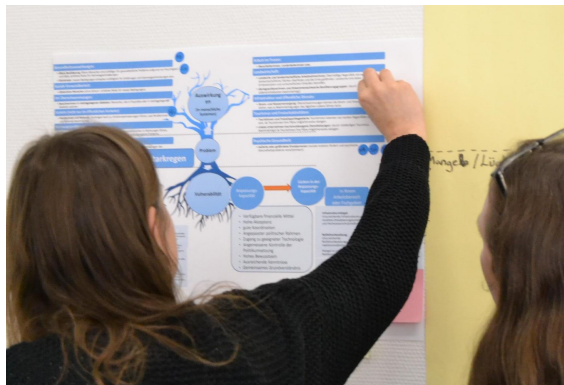
Inception workshop 16.11.2023