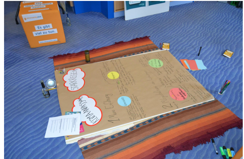
Youth (16-24 years old)